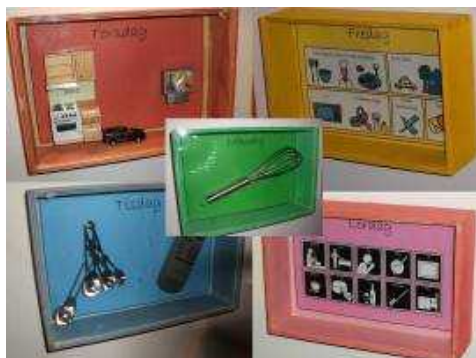
文字以外のコミュニケーションツール