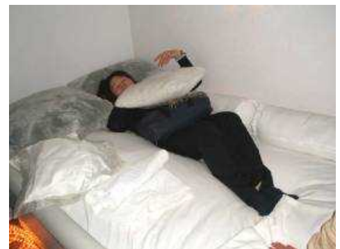
白の部屋 ウォーターベッドでリラックス