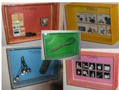
文字以外のコミュニケーションツール