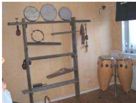
音と音楽療法の部屋