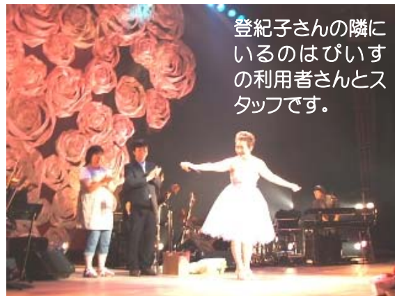
登紀子さんの隣にいるのはぴいすの利用者さんとスタッフです。

*コンサートの収益金は、社会就労センターぴいすのパン製造設備購入に活用させていただきました。