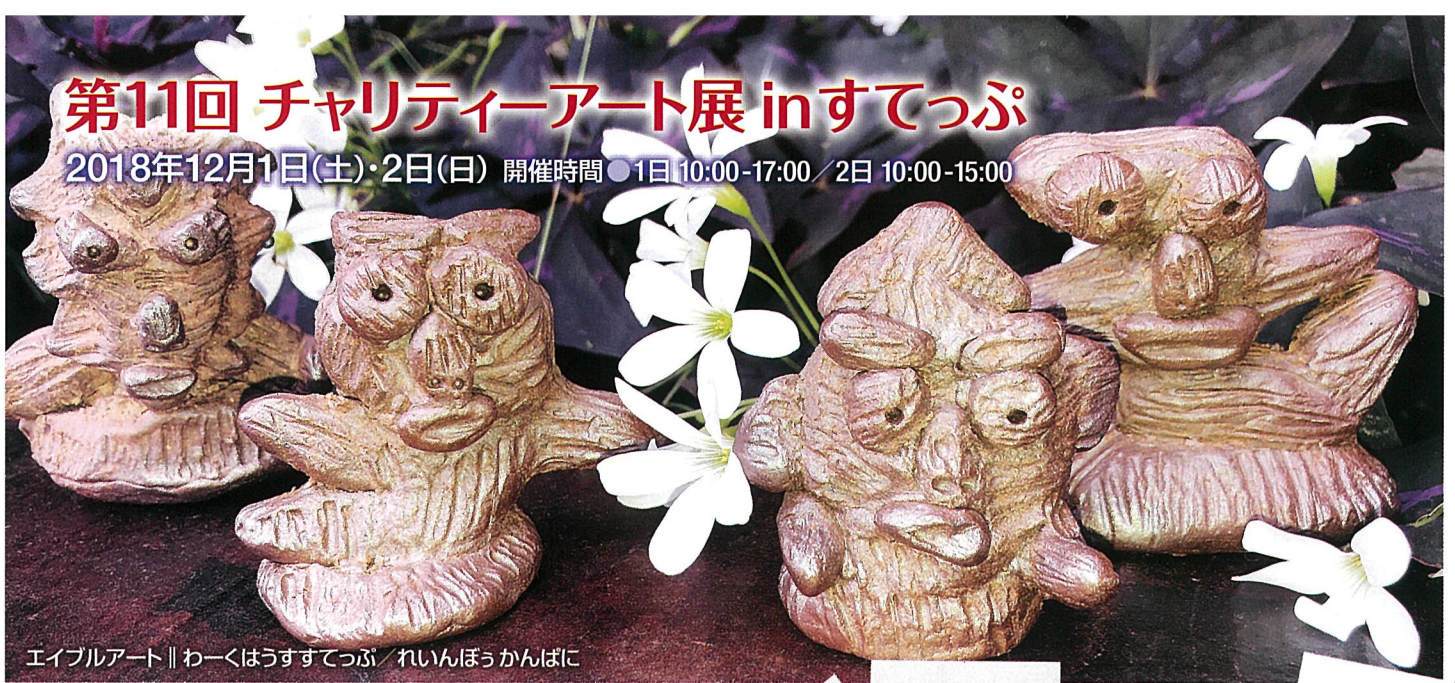
エイブルアート // わーくはうすてっぷ / れいんぼうかんぱに

2018年12月1日(土)・2日(日) 開催時間 ●1日 10:00-17:00 / 2日 10:00-15:00