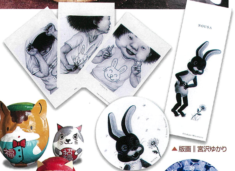
▲ 版画 // 宮沢ゆかり