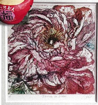
▲ 版画 // 青木洋子