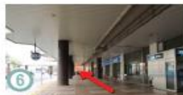
⑥ 右手を向きますとコンビニエンスストアがご覧いただけます。奥のだるま壁面までまっすぐお進みください。