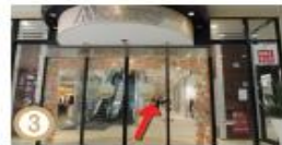
③ コンコース西口突き当たりまで進み右側に高崎駅ビル「モンレー」が見えたら、中に入りましょう。ホテルメトロポリタン高崎の表示もご覧いただけます。