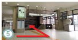
⑤ 24:30以降はこちらから。コンコース西口突き当たり左手の階段を降りて、一度外に出ましょう。