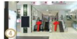
④ 「モンレー」に入りまっすぐ進みますと正面にエスカレーター、階段がございます(キャリーバックをお持ちのお客様はエスカレーターもしくはスロープをご利用ください)。上がって右手の服屋さんの奥にAのエレベーターがございますので、6階ホテルロビー・フロントまでお上がってください。(こちらのエレベーターは24:30までの稼働となります)