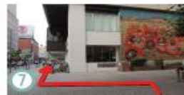
⑦ だるま壁面まで着きましたら、そのまま建物沿いに道なりにお進みください。