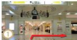
① 新幹線改札口からまっすぐ進みますと正面上部にJRの案内板がございます。西口方面にホテルメトロポリタン高崎の表示もご覧いただけます。コンコースを西口方面にお進みください。