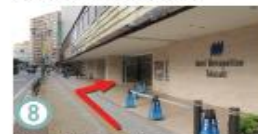
⑧ 30m程進みますと右手にホテルメトロポリタン高崎正面エントランスがご覧いただけます。エントランスお入りいただきエレベーターで6階ロビーフロントまでお上がってください。