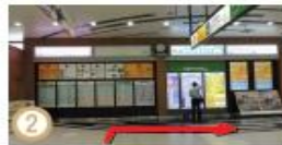
② JR高崎駅改札口から出ますと正面にピアノの形をした時計がご覧いただけます。コンコースを右手の西口方面にお進みください。