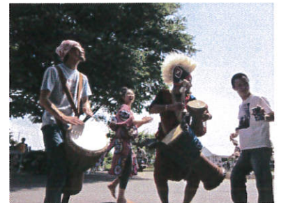
サブニユマ sabunyumaのみなさんによる 西アフリカ太鼓とダンスのステージ