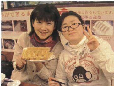
念願の羽付餃子とピース！

2日目、目指すは宇都宮の餃子。「来らっせ」という宇都宮市内の有名な店の餃子を選ぶことができるシステムでした。見事な羽付き餃子に感動しながら思う存分宇都宮餃子を満喫し、楽しい時間を過ごしました。