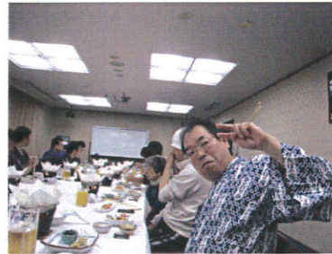
宴会は料理・カラオケを堪能

新緑の映える晴天に恵まれた5月11日・12日と、一泊旅行へ行ってきました。初日に立ち寄った大笹牧場へ行く途中の霧降高原では、幻想的な景色を車窓から見る事ができ、普段見ることができない素晴らしい眺望に、利用者さん達も感動していました。大笹牧場では、昼食のジンギスカンを楽しみ、その後宿泊先であるかんぼの宿へ。夜の宴会は、美味しい料理やカラオケ、温泉等、楽しい時間はあっという間に過ぎてしまいました。