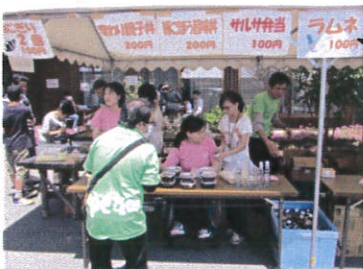
大学で販売している弁当コーナー