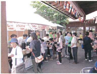
大盛況の食事コーナー

今年のテーマは、『すてっぷ再発見!!』 現在、法人で運営している12の事業所の事を「もっと知ってもらおう!!」ということを中心に所々に事業所紹介を盛り込んだ企画となりました。