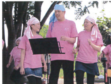
わーく生活介護班の 利用者さんによるステージ発表